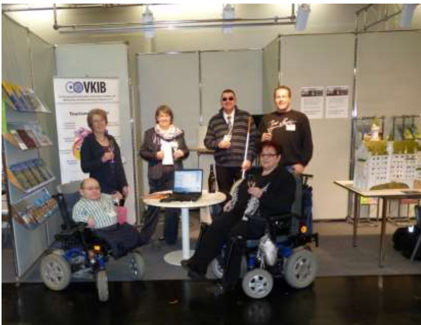
Das Team am Sonntag