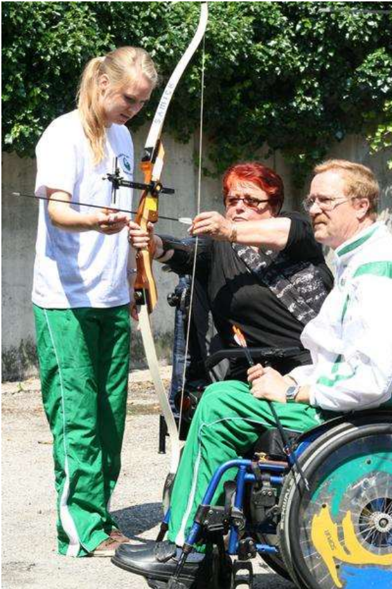
Bei den Bogenschützen

Es war ein großes Miteinander, auf dem Stadtplatz in Marktoberdorf. Sieben Stunden lang Abwechslung an 40 verschiedenen Ständen, dazu ein prall gefülltes Bühnenprogramm und eine Stadtrallye.