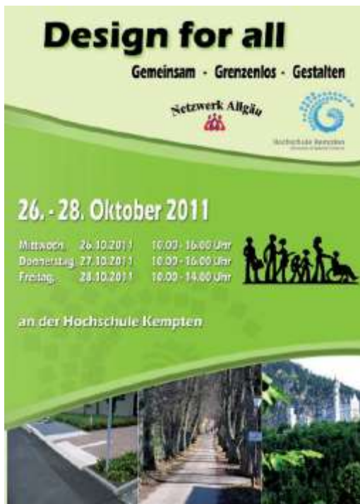
Flyer Fachtagung Design for all 2011