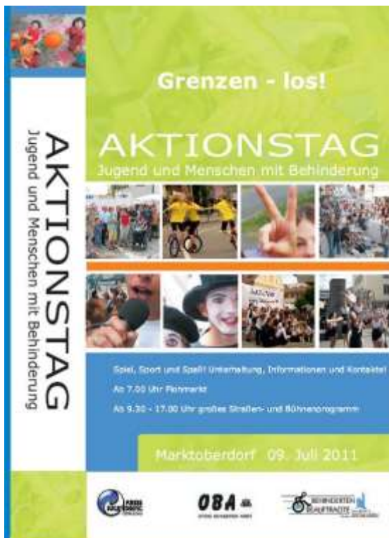
Flyer Aktionstag 2011