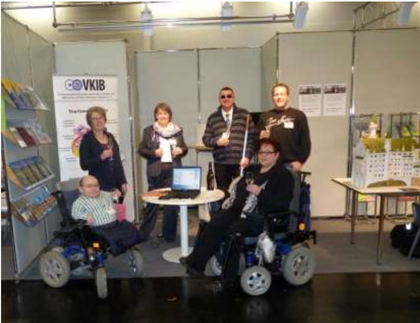
Das Team am Sonntag